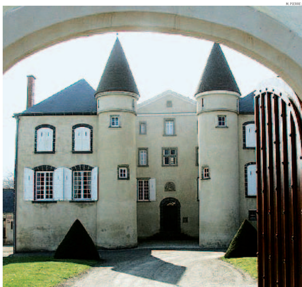
Così Oltralpe. In Francia i castelli del patrimonio francese sono 43 mila e ogni anno in media se ne vendono l'1%, attraverso le poche agenzie specializzate, i notai e il passaparola (nella foto "La Varvasse", si veda a lato)

© RIPRODUZIONE RISERVATA www.ilssole24ore.com Photogallery sui castelli italiani