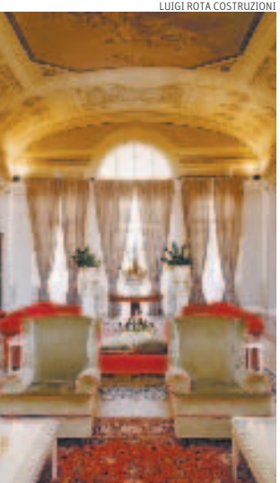
Lavoro ad arte. Interno ristrutturato delle Terme di San Giuliano (Pisa)

Più difficile parlare di costi delle finiture, dai tessuti agli arredi interni. Eccellenza del settore è il gruppo Rubelli di Venezia, azienda fondata nel 1835 e oggi alla quinta generazione, che produce e commercializza tessuti per arredamento di alta gamma come broccati, damaschi, velluti e sete. Fra le prime